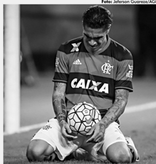
Decepção: Punição do TAS frustrou os planos de Paolo Guerrero

A FIFPro, associação dos jogadores de futebol, também declarou apoio e pediu a liberação de Paolo Guerrero para atuar no Mundial da Rússia. Os capitães da França, Dinamarca e Austrália, rivais do Peru na fase de grupos da Copa, manifestaram-se a favor do centroavante, assim como Diego Maradona.