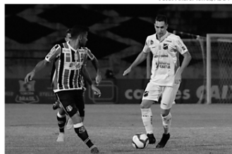
Santa Cruz foi surpreendido pela equipe potiguar, dentro do Arrudaão

Mesmo com a vantagem da vitória por 1 a 0 no primeiro jogo, o ABC entrou em campo buscando o ataque a todo instante. Apesar de o Santa Cruz arriscar ainda nos 40 segundos de jogo, na bomba de Arthur defendida por Rodrigo Carvalho, foi o time Alvinegro que saiu na frente. Aos sete minutos, Arez cruzou ras-