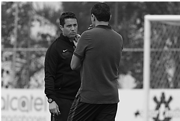
Osmar Loss assume o lugar de Fábio Carille, que deixa o Timão após aceitar proposta milionária da emergente Al-Wehda, equipe da Arábia Saudita.

Essa será a segunda vez que Osmar Loss dirigirá uma equipe profissional. Em 2015, ele comandou o Bragantino no início da Série B, mas não obteve bons resultados e retornou à base do Timão. Agora, tem a missão de manter o Corinthians em alta.